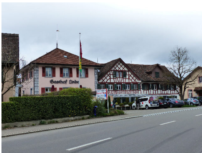
Restaurant Linde, Wängi