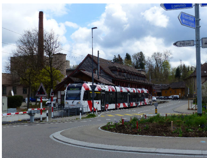
Bahnhof Wängi mit FWB